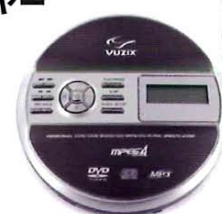
Vuzix Screenless Portable DVD Player

Vuzix ポータブルDVDプレイヤーはすべてのビデオアイウェア・Wrapシリーズでみるために理想的につくられています。内蔵モニターを装備しないことで軽量化を実現し、録画した地デジ番組をみるためのCPRMにも対応しています。モバイル環境において、DVDをみるには欠かせないものになります。