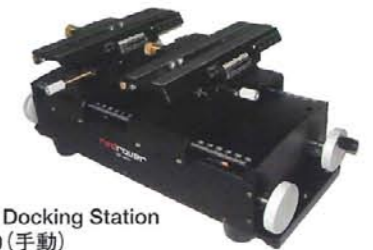
平行式RIG Docking Station SDC-M200 (手動)