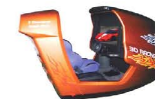
Xtation 4D Ride