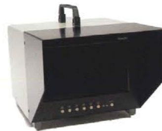
WVGA 8 8インチ View Finder 3Dモニター SDM-080 (800×480)

3D放送や映像の撮影現場では、True3Di 8インチモニターを使用しリアルタイムに撮影映像をモニタリングできます。