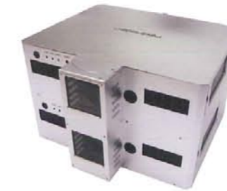
3Dプロジェクター RP-D4000 (XGA 4000ANSI ルーメン)

3D立体映像プロジェクターRP-D4000は4000ANSIルーメンの明るさで3D立体映像を高解像度でリアルに表現でき、3D映画やVR（バーチャルリアリティ）、製品開発、建築や教育など幅広い3D映像用途に適しています。RP-D4000は、一般企業や教育現場での手軽な3D立体プレゼンテーションを実現できます。