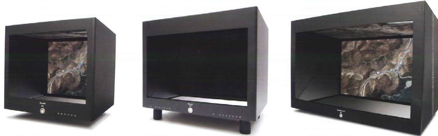
SXGA 19 19インチ SXGA SDM-190M (1280×1024)